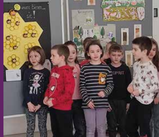
Die Kinder präsentieren ihre Arbeiten.