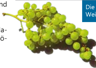
Die Brunner Weinbaubetriebe laden zur Weinpräsentation in den BRUNO-Festsaal.