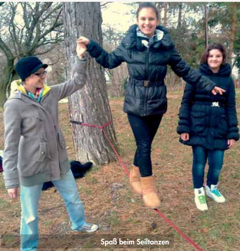
Spaß beim Seiltanzen

„Den eigenen Körper fest im Griff haben, ihn steuern, auch wenn's ziemlich wackelig wird und auf die helfenden Hände der anderen vertrauen, das ist eine wichtige Erfahrung, die im Turnunterricht ein ganz wichtiges Ziel ist“, beschreibt sie nachstehendes Foto.