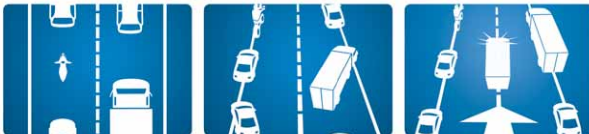
DIE RETTUNGSGASSE AUF ZWEI SPUREN

Weitere Infos auf www.rettungsgasse.com oder 0800 400 12 400.