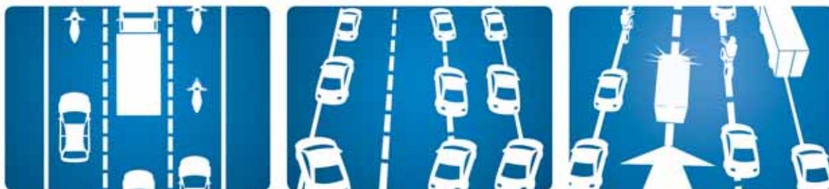
DIE RETTUNGSGASSE AUF MEHREREN SPUREN